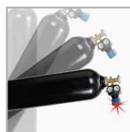
PUNTO DE IMPACTO ÚNICO