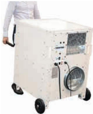
Fácil de transportar