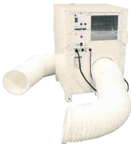
AC 24 - Ø 31 cm