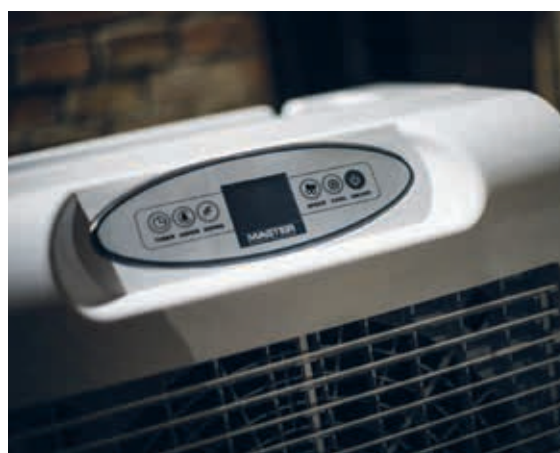
CCX 4.0 Panel de control