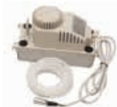
Bomba de agua para DH-752 y DH-772 Altura máxima de extracción - 4 m 4512.440