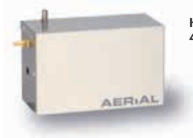
Kit bomba PK-Uni 4620.111