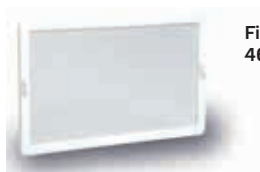
Filtro de repuesto 4620.110