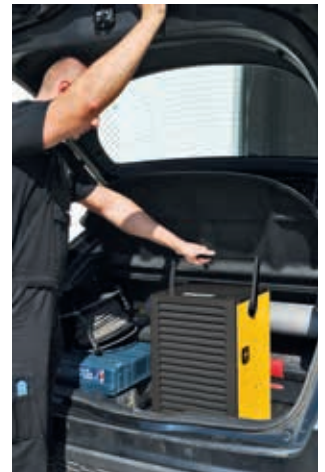
Carcasa ligera y compacta