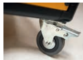
Ruedas con freno