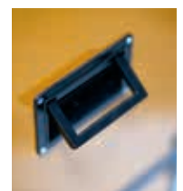
Asas plegables y ruedas