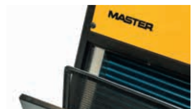
Filtro de aire