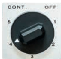
Sensor de humedad incorporado