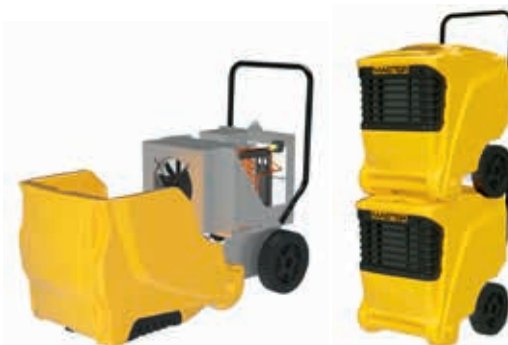
Con fácil apertura para la limpieza