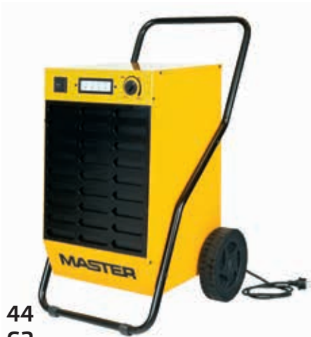
DH 44 DH 62 DH 92