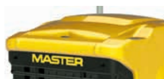
Una carcasa de plástico resistente