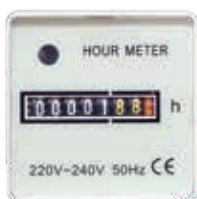
Contador de tiempo