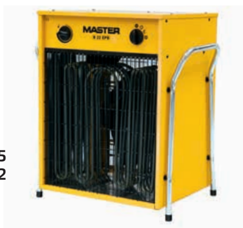
B 5 B 9 B 15 B 22