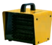
B 2PTC B 3PTC