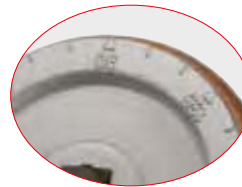
Horma de aluminio forjado con escala del radio de curvatura