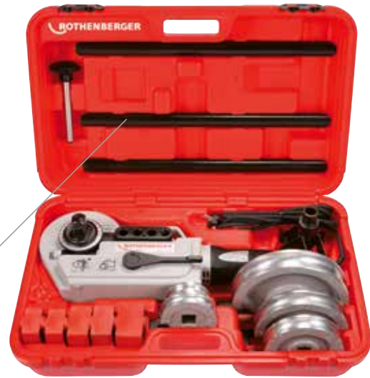
Fig. ROBEND 4000 Set

Garantiza una distribución óptima de la lubricación