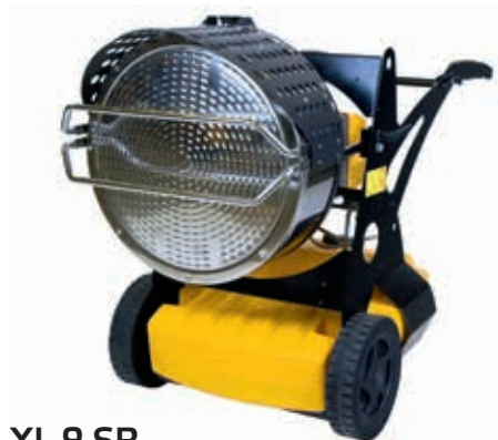
XL 9 SR

Es imprescindible una ventilación adecuada del local, para garantizar la aportación necesaria de oxígeno.