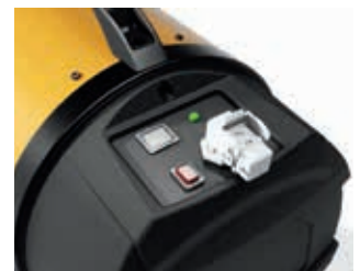
DISPLAY Y ENCHUFE PARA TERMOSTATO