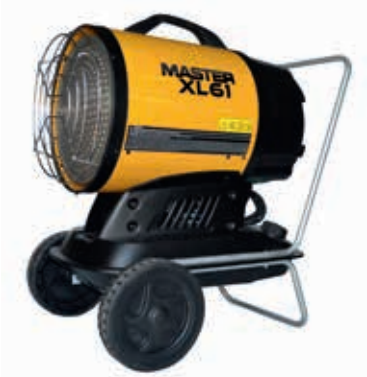
XL 61 CON CARRO CON RUEDAS (OPCIONAL)