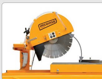
Cabezal basculante regulable en altura Posibilita el corte hasta 220 mm.