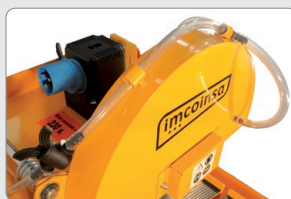
Eficaz y robusto sistema de refrigeración por agua Alarga la vida útil del disco.