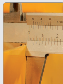
Estructura reforzada Estabilidad en el corte y larga vida útil.