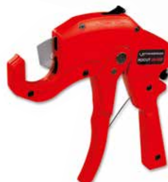
Nº. 55005 / Nº. 55015