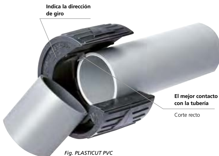
Fig. PLASTICUT PVC