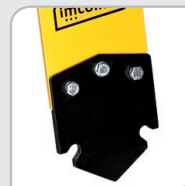
Cód 21605P Base cincel.