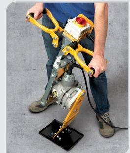
Doble empuñadura Fácil, seguro y preciso manejo del equipo.