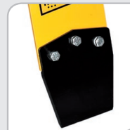
Cód 21605C Base en punta.

Por otro lado, la versión eléctrica está especialmente indicada para trabajos en interiores, canalizaciones profundas, etc. donde se requiere un aire libre de humos y/o una baja emisión sonora.