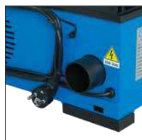
Boquilla de aspiracion