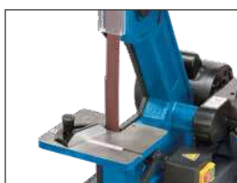
Mesa de frente