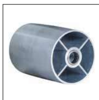
Rodillo remolcado con rodamiento