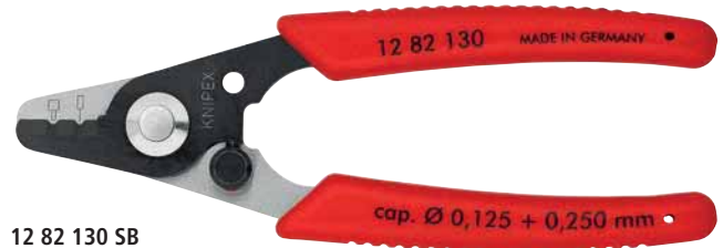
12 82 130 SB