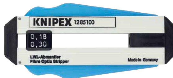
12 85 100 SB