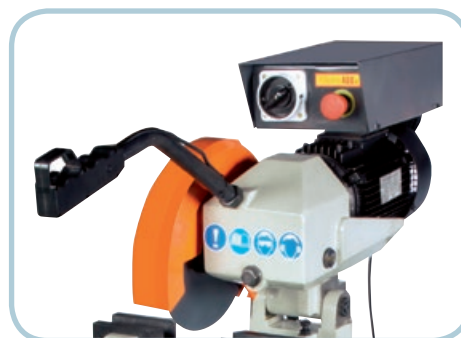
Cabezal giratorio MG-250-CS Swivel head MG-250-CS