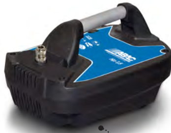
COMPY O15 1,5 hp, sin depósito, sin aceite