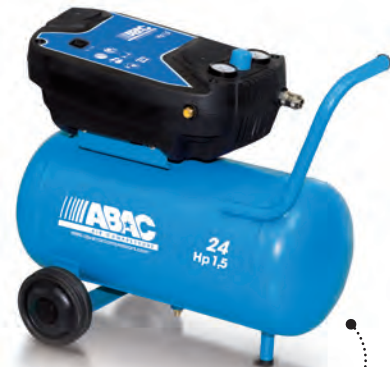
POLE POSITION O15 1,5 hp, 24 litros, sin aceite