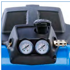
Doble control de presión: interna y regulada