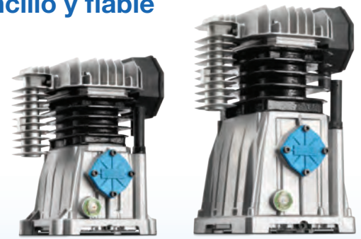
Cabezales ABAC A29(B)-A39(B) con superiores características

(*) Diferencial aproximado con respecto a Cabezales Antiguos B2800(B)-B3800(B)