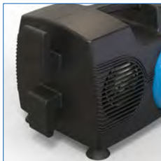
Enrollador de cable integrado