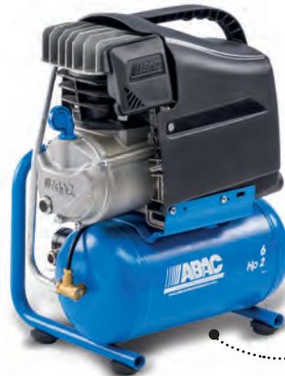
START L20 2 hp, 6 litros