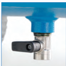
Válvula de drenaje grande y fácil de usar