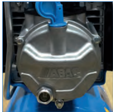
Visor de aceite integrado