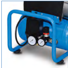
Bastidor de protección de elementos