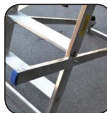
Detalle maneta de transporte Détail poignée de transport Detalhe alça de transporte