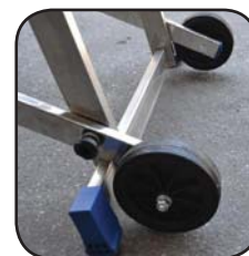
Detalle ruedas Détail roues Detalhe rodas