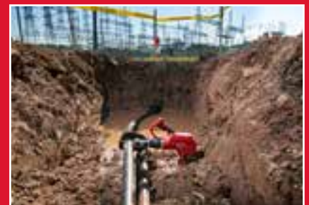
El diseño de la mandíbula abierta facilita el acceso en las zanjas