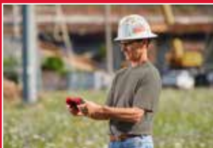
Permite al operario realizar cortes remotos SIN CABLES, eliminando cualquier conexión física a la herramienta