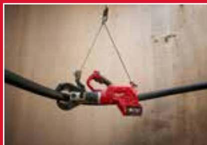
Diseño equilibrado, el mango y el gancho nos permiten colocar la herramienta en zonas de difícil acceso