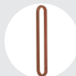
ESLINGAS REDONDAS Pág. 91