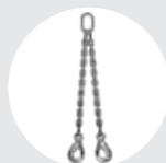
ESLINGA "DOL" Pág. 80