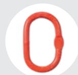
ANILLA OVALADA Pág. 74