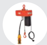
POLIPASTO DE CADENA MODELO COMPACT Pág. 117