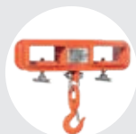
ÚTIL CARRETILLAS MODELO UCAR Pág. 56