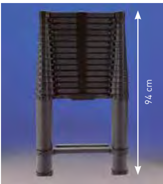
Escalera cerrada 94 cm

Cierre automático. Distancia entre peldaños 30 cm. Tacos de apoyo antideslizantes en PVC.