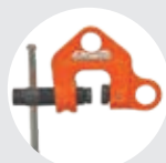
GARRA DE HUSILLO MODELO WF Pág. 39