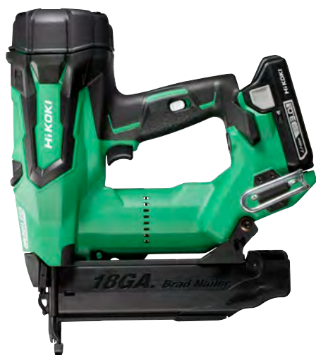
CLAVADORA DE ACABADO A BATERÍA DE LITIO