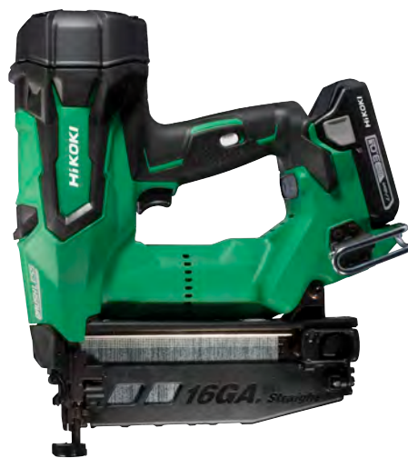
CLAVADORA DE ACABADO A BATERÍA DE LITIO