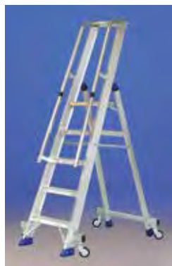
Regina VIP con ruedas Suplemento

Plataforma de aluminio reforzado 25,5x35 cm. Peldaños de 8 cm de profundidad. Astas de acero antiapertura.