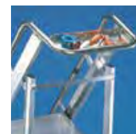
Amplia plataforma de trabajo de 45x50 cm. Amplia bandeja portaherramientas