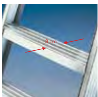
Peldaños soldados de 8 cm de profundidad

Escalera profesional con subida por 2 lados.