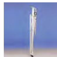
Se puede plegar para el transporte o almacenamiento