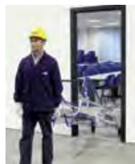
Ruedas para transporte