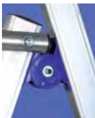
Articulación de acero

Plataforma de aluminio antideslizante de 58x44 cm. Altura rodapié 10 cm. Dispone de guarda-cuerpo perimetral 360°. Incluye bolsa porta-herramientas Sveltbag. Medida con los estabilizadores abiertos: 1,44 m (3/4 peldaños) / 1,68 m (5/6 peldaños) / 2,02 m (7 peldaños). Conforme a la norma EN131/7.