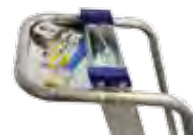
Bandeja portaherramientas y barandilla de subida

Escalera profesional con peldaños de 8 cm. de profundidad, soldados. Distancia entre peldaños 25 cm.