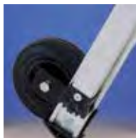
Ruedas de Ø150 mm