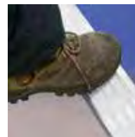
Peldaños de 8 cm de profundidad

Plataforma de aluminio antideslizante de 60x53 cm. Altura rodapié 10 cm. Dispone de guarda-cuerpo perimetral 360°. Barandillas plegables. Incluye bolsa porta-herramientas Sveltbag. Medida con los estabilizadores abiertos: 1,52 m (3/4 peldaños) / 1,76 m (5/6 peldaños) / 2,10 m (7/8 peldaños). Conforme a la norma EN131/7.