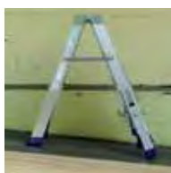
Accesorio opcional para desnivel