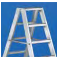
Barra de hierro anticierre