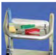
Bandeja portaobjetos 13x29 cm