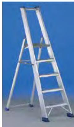
Regina Maxi con plataforma de aluminio y astas antiapertura de acero