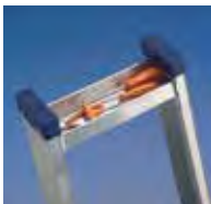
Bandeja portaherramientas en la parte superior