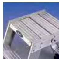
Plataforma de apoyo de 35x39 cm

* OPCIONAL: Kit de 2 ruedas Guardacuerpo superior Kit 2 barandillas de subida