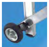
Ruedas para su desplazamiento

Escalera profesional con peldaños de 8 cm de profundidad, soldados. Distancia entre peldaños 25 cm.