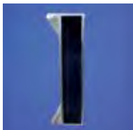
OPCIONAL: Nuevo perfil "D"