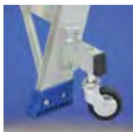
OPCIONAL: ruedas autofrenantes